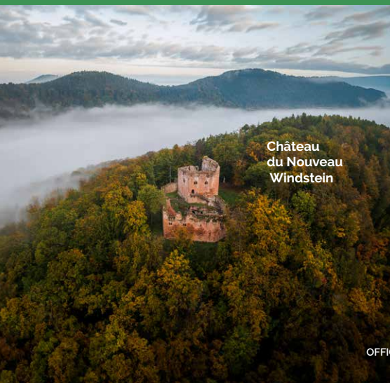
Château du Nouveau Windstein

8 cols des Vosges fermés à la circulation routière pour vous permettre de les gravir à vélo tout au long de l'été !