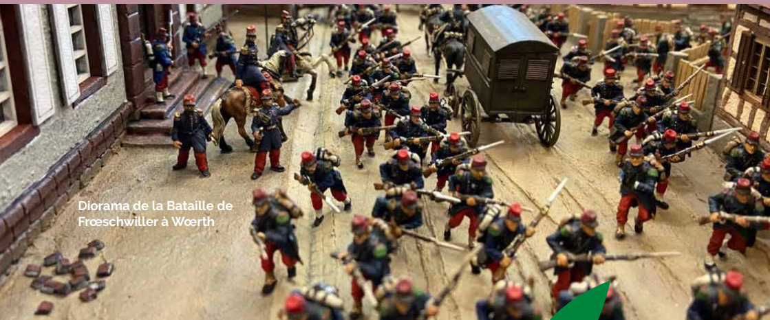
Diorama de la Bataille de Froeschwiller à Woerth.