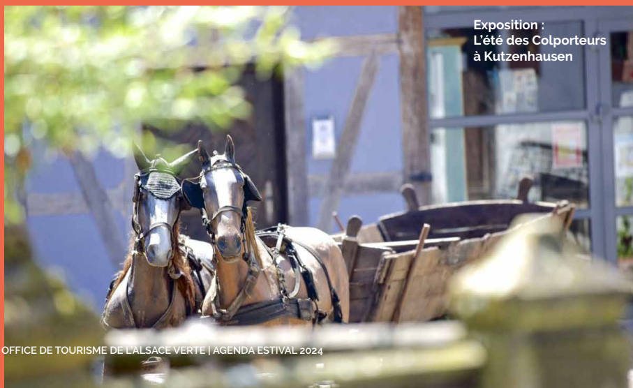
Exposition : L'été des Colporteurs à Kutzenhausen