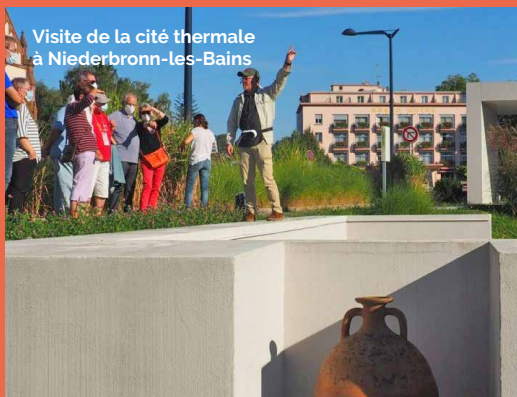
Visite de la cité thermale à Niederbronn-les-Bains

Comment vivaient nos ancêtres pendant la Préhistoire ? Des découvertes archéologiques nous renseignent sur leur mode de vie et leur capacité à résoudre les problématiques de leur quotidien.