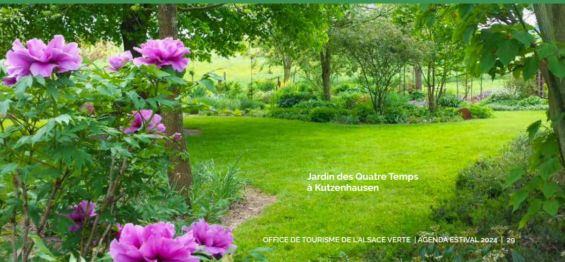
Jardin des Quatre Temps à Kutzenhausen

Le Jardin des 4 Temps ouvre ses portes à la visite pour une journée sur le thème biodiversité au jardin.