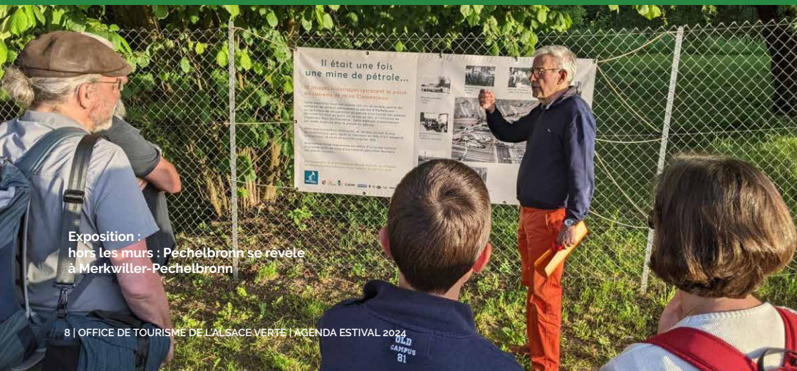
Exposition : hors les murs : Pechelbronn se révèle à Merkwiller-Pechelbronn

Le Père Joseph est à l'origine de plus de 200 monuments français. Il a su mobiliser le peuple français et allemand. Découverte de son histoire et ses œuvres à travers cette exposition.