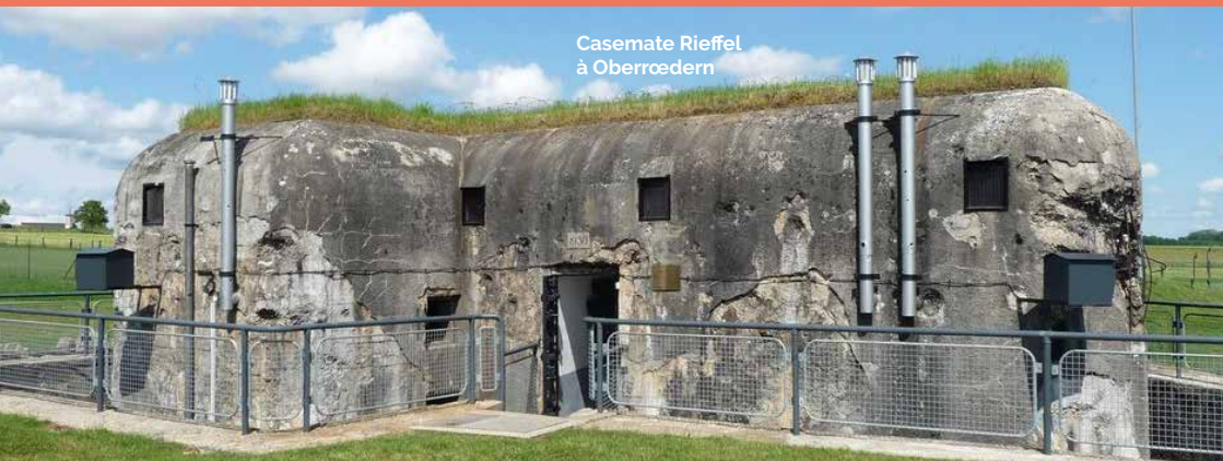
Casemate Rieffel à Oberroedern

Accueil en tenue de soldat de 1940 et découverte du quotidien des soldats de la casemate. Reconstituants français avec véhicules des années 40.