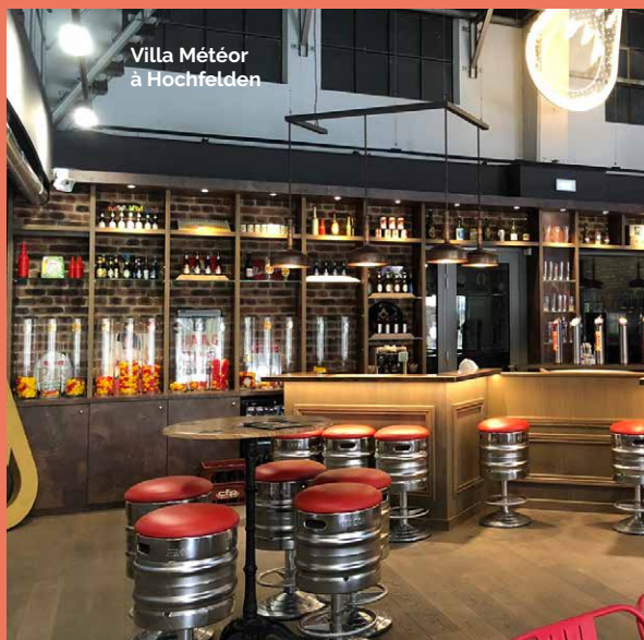
Villa Météor à Hochfelden

Le club de marqueterie est heureux de vous présenter ses œuvres et réalisations annuelles lors d'une exposition alliant créativité et savoir-faire !