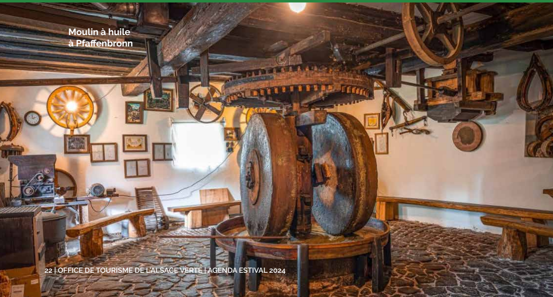
Moulin à huile à Pfaffenbronn

Avis aux passionnés de véhicules anciens, profitez de ce rassemblement mensuel pour découvrir des modèles de collection variés (une vingtaine en moyenne par rassemblement).