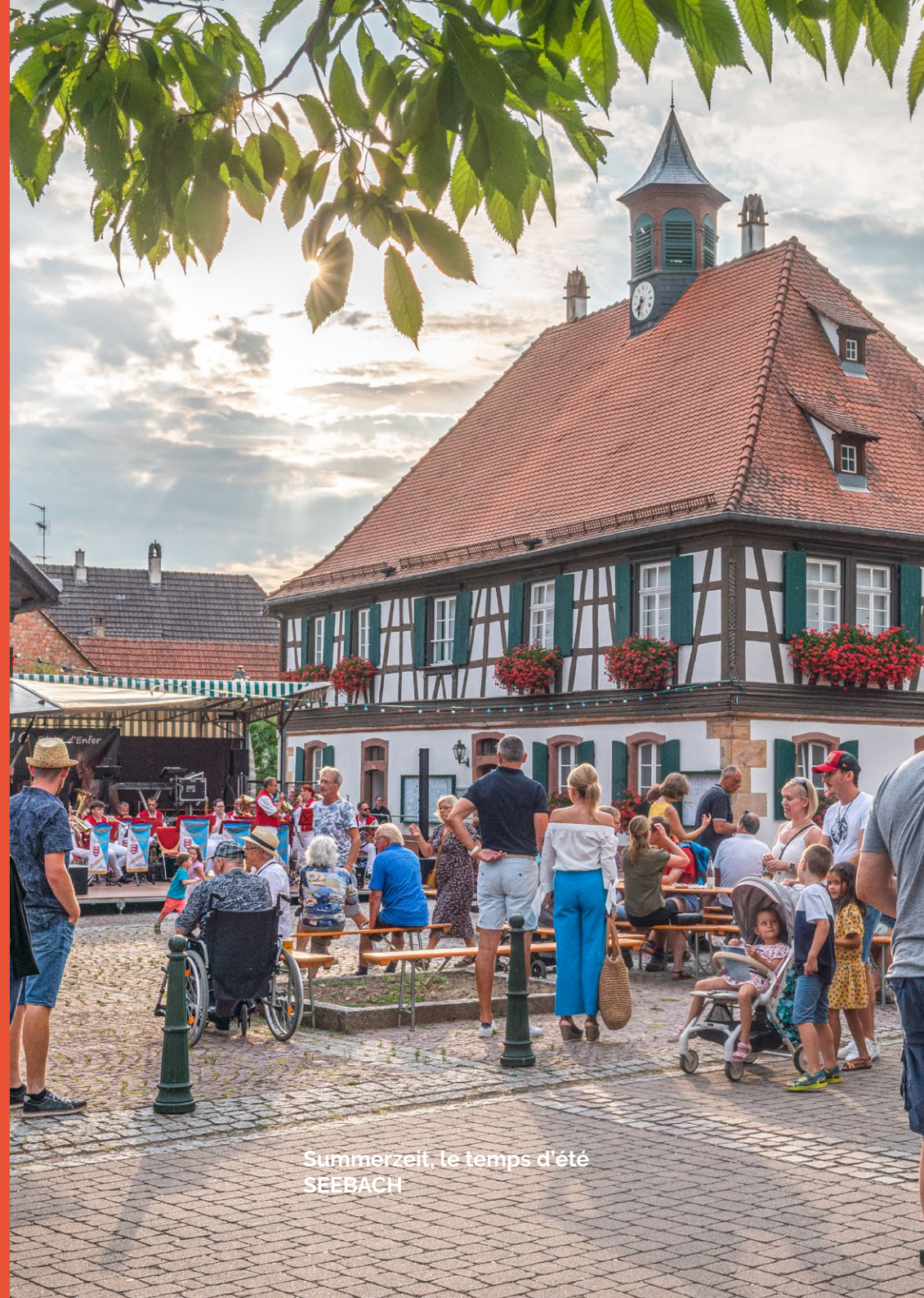
Summerzeit, le temps d'été SEEBACH