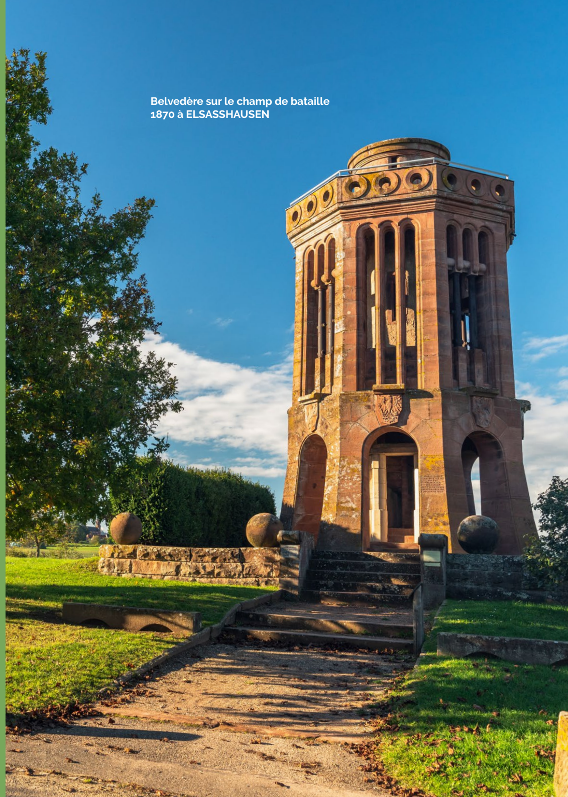
Belvédère sur le champ de bataille 1870 à ELSASSHAUSEN